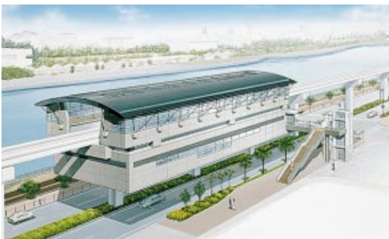
壺川駅完成予想図